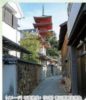
(イメージ)