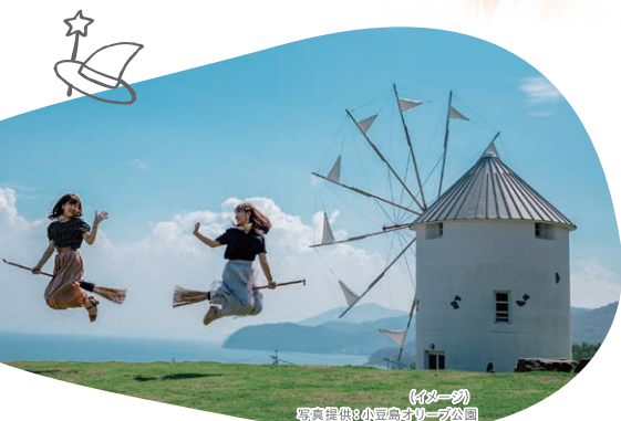
(イメージ)