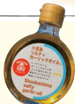
(「小豆島ソルトイガーリックオイル」のイメージ)

④ 小豆郡小豆島町馬木甲842-1 ☎ 0879-82-3333 ④ なし 時 9:00~17:00 (日曜日は10:00から17:00)