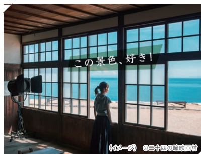
(イメージ)

④ 小豆郡小豆島町神懸通乙168 (寒霞溪ロープウェイ山頂駅) ☎ 0879-82-2171 (寒霞溪ロープウェイ) 寒霞溪ロープウェイはWebサイトを要確認