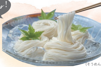
(そうめんのイメージ)