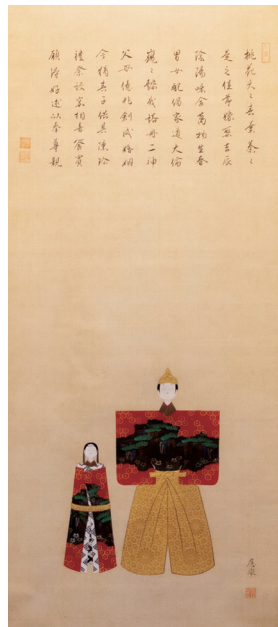
円山応挙《紙雛》 江戸時代中期(天明期)