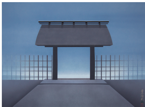
濱野年宏《桂離宮-御幸門》 2022年