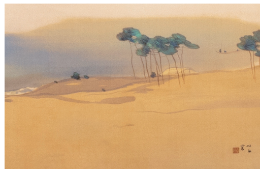
竹内栖鳳《春潮》 明治後期～昭和初期