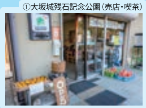
①大坂城残石記念公園 (売店・喫茶)