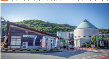
일본의 석양 100선'에 선정된 미치노에키·우미노에키 휴게소. 체험형·종합 레저시설이 있다.