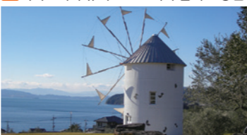
세토내해를 내려다보는 나즈막한 언덕 위에 펼쳐진 올리브밭과 하얀 그리스 풍차는 절경 촬영 스팟