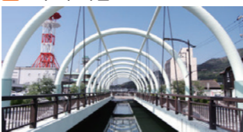
기네스가 인정한 세계에서 제일 좁은 해협 최소폭 9.93m 건너는 기념으로 횡단증명서를 발행