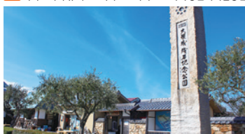
사적 '오사카성 돌담 이시키리와 토비고에초바타 및 오미잔석군'과 귀중한 자료, 도구 등을 전시