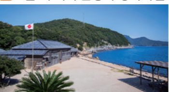
영화 '스물 네 개의 눈동자' 로케 세트장을 새롭게 만든 영화·문학의 테마파크 예술작품들을 포함하는 사진 스팟이 많다