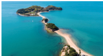
조수의 간만으로 길이 나타나, 소중한 사람과 손을 잡고 건너면 소원이 이뤄진다는 연인의 성지