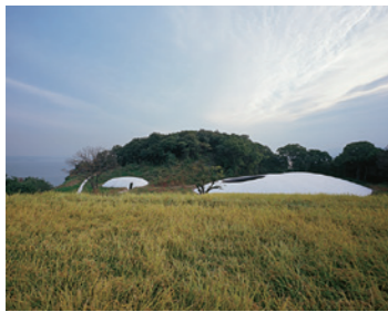
아티스트 나이트 레이, 건축가 니시자와 류에에 의해 세토내해를 바라다보는 언덕 위에 세워진 미술관