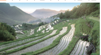
유네스코미즈를 물의 근원으로 하는 약 800정의 계단식 논이 물결 모양으로 펼쳐져 있으며, '일본의 계단식은 100선'에도 지정되었다