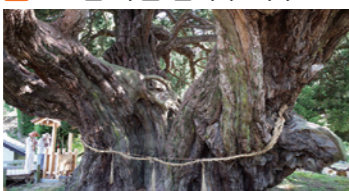
수령 1600년 이상의 국가 지정 특별 천연기념물 뿌리 둘레 약 16.9m, 높이 약 20.9m