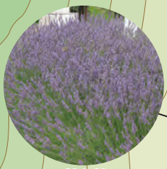
薰衣草 (6月上旬~7月下旬)