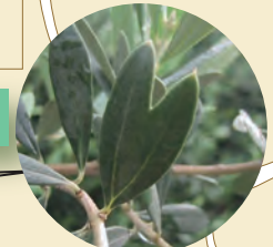
橄欖樹柵欄 ~探尋幸福的橄欖~