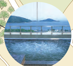
大自然的饋贈 (天然溫泉和瀨戶內海及沿海一帶的新鮮海鮮)