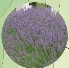
薰衣草 (6月上旬~7月下旬)