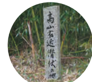
右近潜伏地石碑 (新中山池跟前)