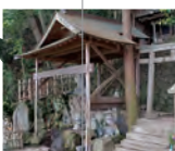
名水百选“汤船之水”

这是位于千枚田的共用洗涤场。有清洗蔬菜和衣服的场所，是一处从田里回来的人们清洗蔬菜、洗涤场话家常（而不是井边话家常）的休憩场所。