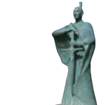
高山右近像 (天主教小豆岛教堂)

天主教大名高山右近被下达天主教徒追放令（1587年）的丰臣秀吉逼迫弃教，他断然拒绝而被全国追捕，曾在同为天主教大名的管辖小豆岛的小西行长的保护下隐居岛上。岛上随处可见据推测是天主教遗物的灯笼和石像。