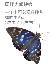
国蝶大紫蛱蝶 一年中可参观各种各样的生态。 (成虫7月左右)