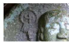
锡杖上雕刻着十字的石像（汤船山）