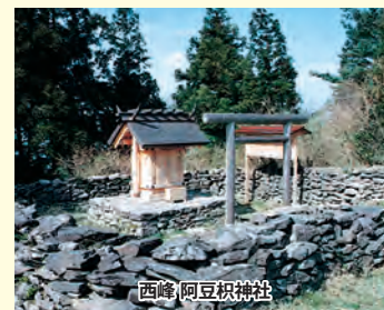
西峰阿豆枳島神社