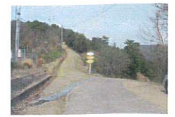
道が広いので ここまで車で来られます