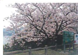
国民宿舎前駐車場の染井吉野 10本ほど4月上旬満開